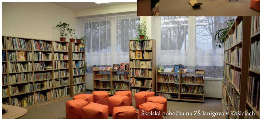
Školská pobočka na ZŠ Janigova v Košiciach