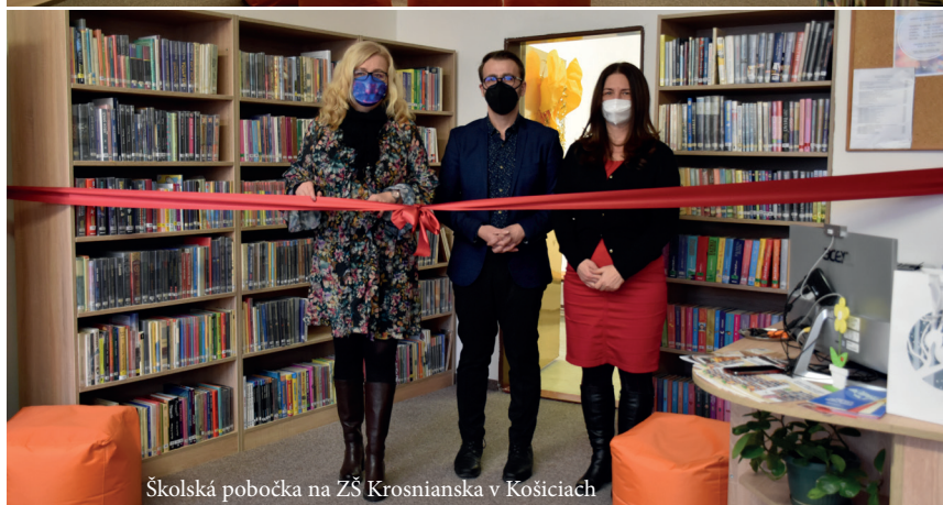
Školská pobočka na ZŠ Krošnianska v Košiciach