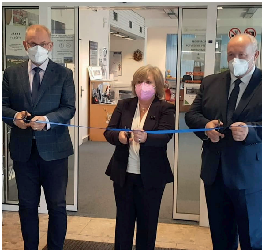
Otvorenie európskeho informačného centra Europe Direct

Projekt EDIC znamená pre akademickú knižnicu síce veľa práce, veľa príprav a plánovania, ale výrazne obohacuje náš knižničný svet. Posúva nás ďalej v rozvoji knižničných služieb, pomáha s financovaním mimoriadnych aktivít ( ročný grant cca 30 000 EUR) a podstatne zvyšuje tvorivý potenciál knihovníčok a knihovníkov.